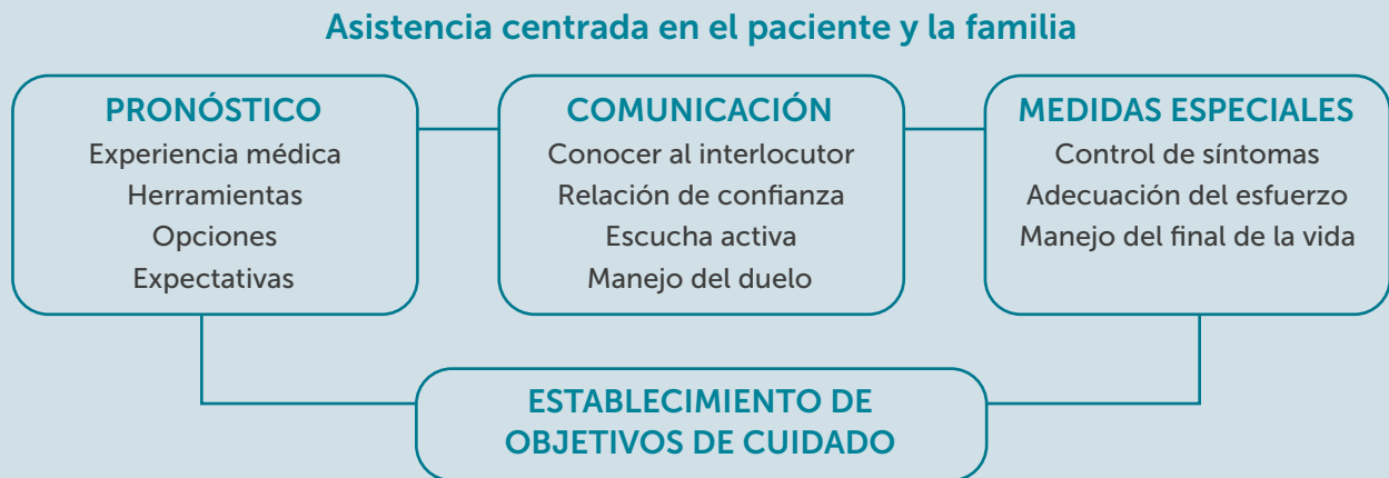
Figura 1. Principios básicos y prácticas recomendadas en Cuidados Paliativos

La atención centrada en el paciente y la familia tiene como objetivo conocer la dinámica psicosocial, las preferencias en cuanto a la cantidad como la calidad de vida esperable analizando el impacto de las posibles secuelas del ictus sobre la calidad de vida, así como las necesidades y los valores individuales de los pacientes y familiares. Estos valores se han de respetar en la toma de decisiones clínicas, que debería tener lugar de manera conjunta. 18